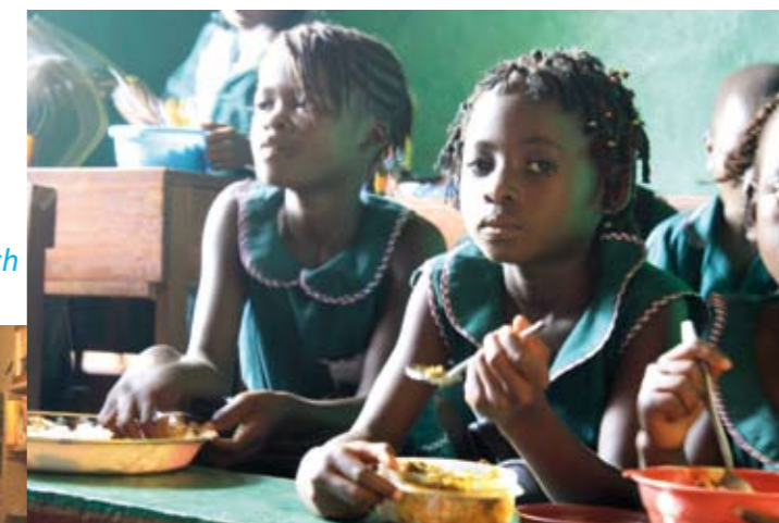
Kinderen in Sierra Leone genieten van hun lunch