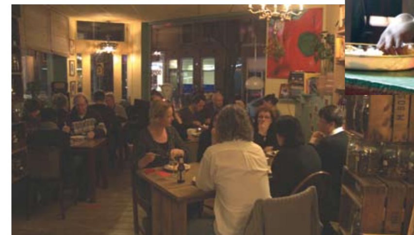
Het netwerkdiner in februari van dit jaar in restaurant The House of Spice heeft al een aantal hele leuke acties opgeleverd